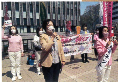
毎月10日定例の「女性への 暴力をなくすフラワーデ モ」に参加!