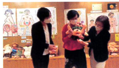
世田谷区アーニホールでの性教育講座に 参加、人形を使った出産シーンを体験