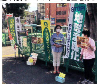
「気候危機全国アクション」に参加! 脱温暖化、 脱原発を進め、食もエネルギーも地産地消を!